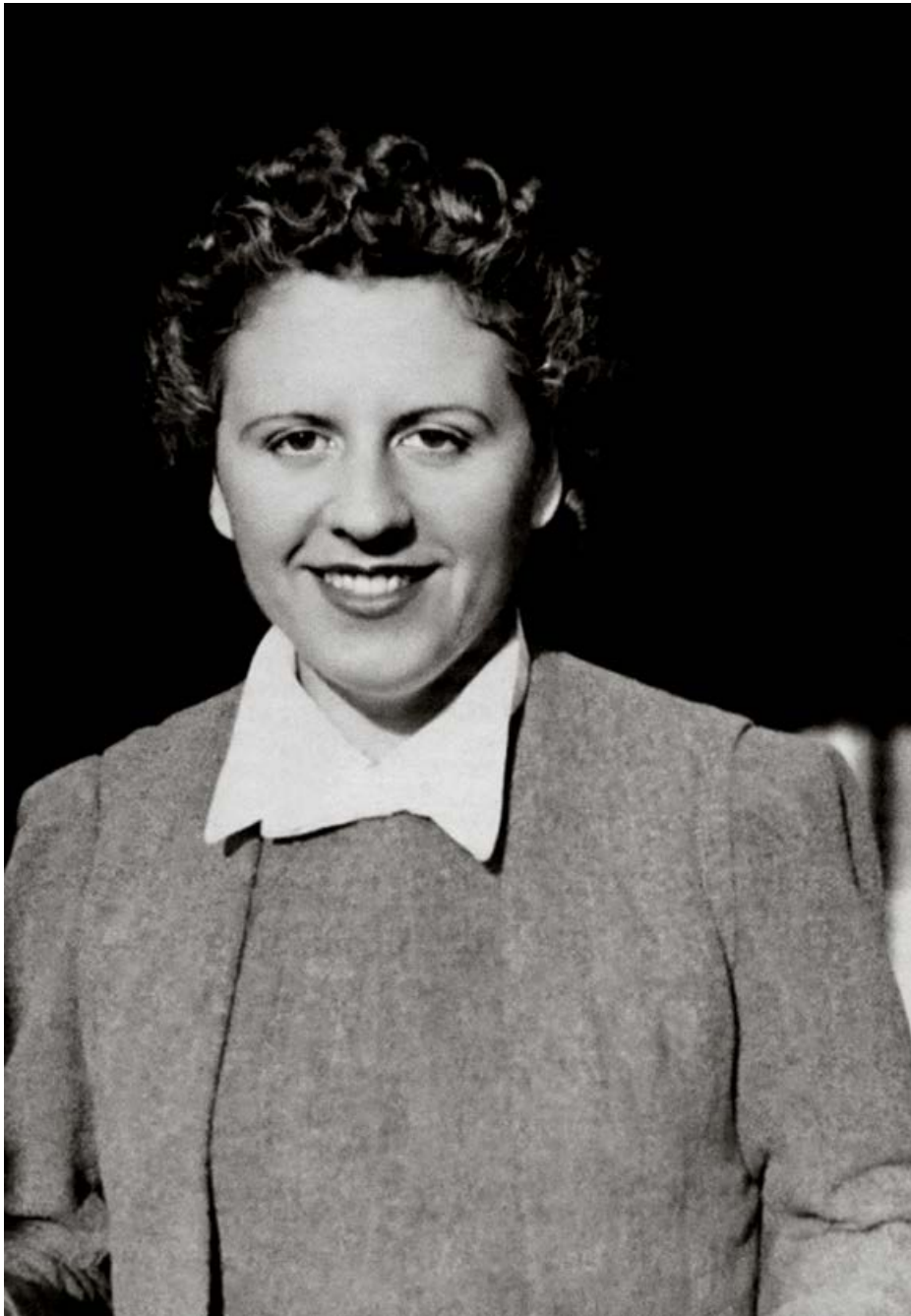
Mercè Rodoreda, 1938. Fotografia.